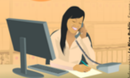
CO_Secrétaire de mairie en chiffres.pdf

Au cours des douze derniers mois, 73 emplois de secrétaire de mairie étaient vacants sur 549 postes en Côte-d'Or. Seule une petite moitié a pu être pourvue.